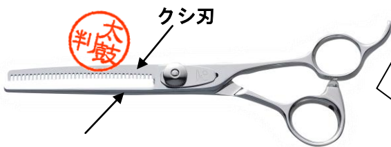
棒刃 キラB/B (37目) 毛量35% B/S¥105,000 (税別)

さおちゃ〜ん！「逆刃のセニング」っていうのは、下記の商品のことだよ！みなさんがメインで使用しているセニングと比べて刃が逆に付いているんだヨ！これは「キラB/B」だよ！