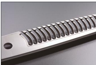
カラムのクシ刃拡大図

こんにちはっ！丸っちです。このカラムのクシ刃を見て下さい！1本1本のクシ刃の角を丸く削っています。お客様の髪の毛を少しでも傷めないように加工しています。刃にここまでこだわってます♪