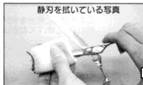
静刃を拭いている写真

☆☆☆1.刃をセーム皮で拭く☆☆☆ こまめにセーム皮で拭いていただけると永切れに繋がります！逆にお手入れをサボっちゃうと、髪の毛が逃げたりサビが出てきたり、最終的には刃こぼれの原因へと繋がりますので、頑張りましょうね！