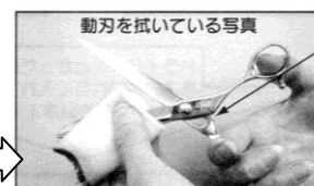
動刃を拭いている写真

静刃、動刃がこすれあう部分「触点」も拭いてネ!! (オイルをさす前は、必ず拭いてネ!!)