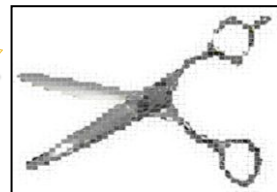
ドライカット用シザー

みなさまにお知らせです！！現在キラでは新商品のシザーをなんと2丁製作中です！！1丁は ドライカット用シザー 、もう1丁は ドライ用セニング です♪♪2丁とも特徴あるシザーで、必ずみなさまのお役に立てる商品ですので、キラから自信を持ってご紹介させていただきます！！新商品は製作中なので、本当はまだお見せすることができませんが、今回は特別にすこ～しだけ写真をお見せします♪♪8月中にはみなさまの前に姿を現すこととなりますので、楽しみにお待ち下さいね！！