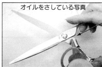
オイルをさしている写真

☆☆☆2.触点にオイルをさす☆☆☆ 最低1週間に1度、米粒の約半分位、ハサミを開いた動刃の触点付近にさしてください★毎日のたったこれだけのお手入れでハサミの寿命はぐーんと長寿に！お手入れしてあげてくださいね～(*^-^*)/~