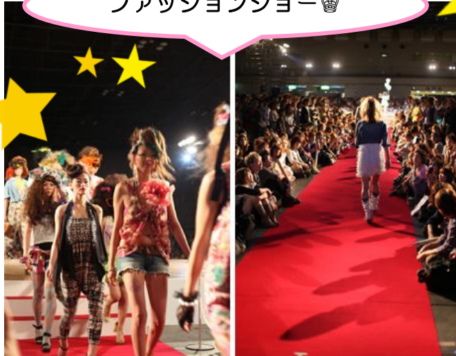
ファッションショー👑