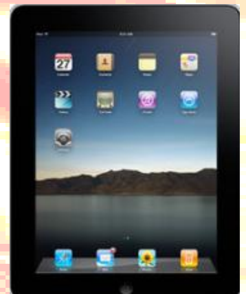
代表機種 i Pad です！！